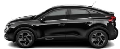
ČIERNÁ OBSIDIEN (M)