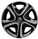
OKRASNÝ KRYT 16" 3D STEEL & STYLE