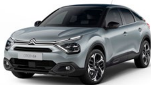
PACK COLOR VAPOR GREY