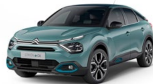
PACK COLOR ANODISED BLUE