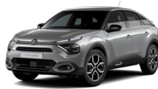
PACK COLOR TEXTURED GREY