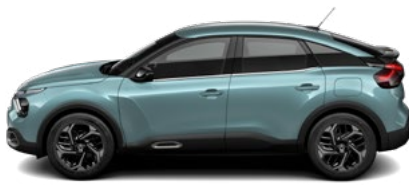
MODRÁ ICELAND (M)