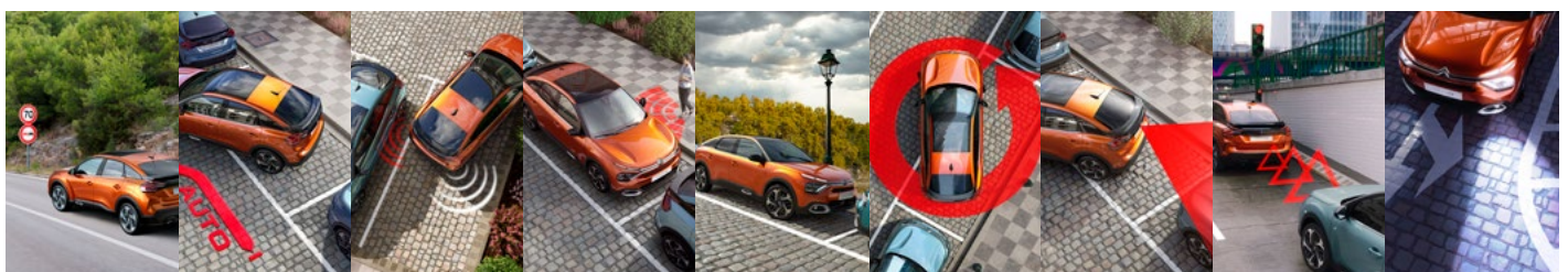
ČÍTANIE DOPRAVNÝCH ZNAČIEK A RÝCHLOSTNÝCH OBMEDZENÍ