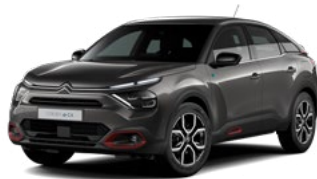
PACK COLOR ANODISED RED