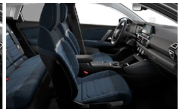
INTERIÉR METROPOLITAN BLUE