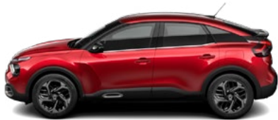
ČERVENÁ ELIXIR (P)

(M) – metalická farba karosérie, (P) – perleťová farba