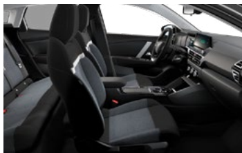
ŠTANDARDNÝ INTERIÉR (PRE LIVE PACK A FEEL)