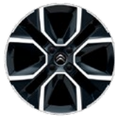
DISK Z LAHKEJ ZLIATINY 18" HANYO