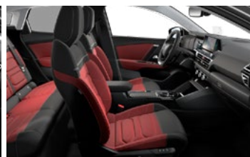
INTERIÉR HYPE RED