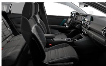
INTERIÉR HYPE BLACK