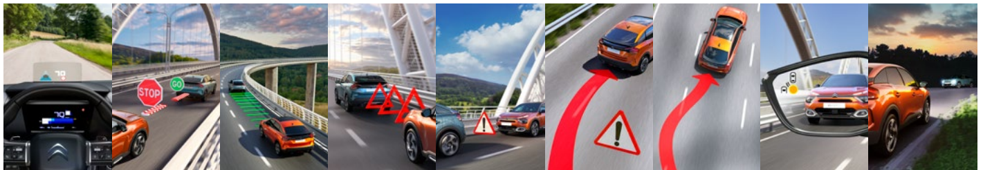
FAREBNÝ HEAD-UP DISPLEJ