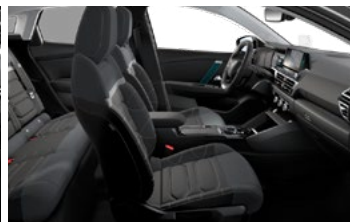
INTERIÉR METROPOLITAN GREY (V SÉRII PRE SHINE)