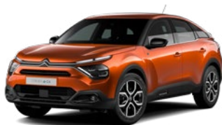
PACK COLOR GLOSSY BLACK