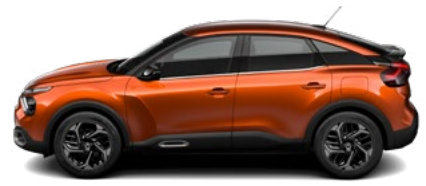
HNEDÁ CAMEL (M)