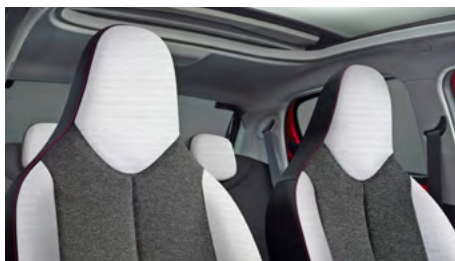
LÁTKA CURIBITA TRITON URBAN RIDE