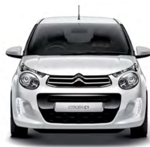
Biela OURAL nemetická