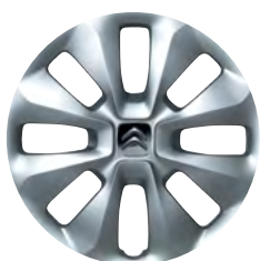
COMET okrasný kryt 15"