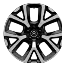
Disk z ľahkej zliatiny ART diamantée, 19"