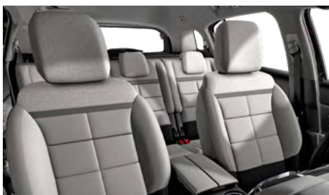
Mix koža GRAINE sivá – sivá látka / METROPOLITAN béžový