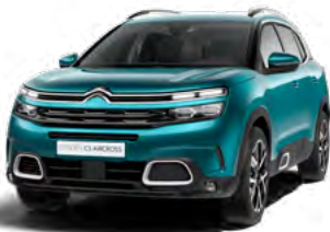
Pack Color White (biela)