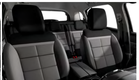
Mix koža GRAINE – grafitová látka / METROPOLITAN sivý