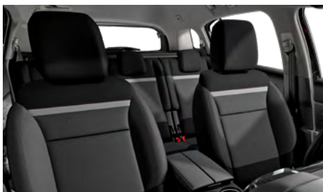
Látka SILICA sivá (v sérii pre FEEL)