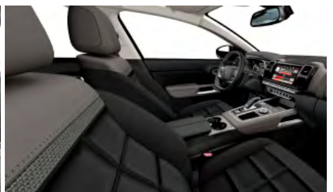
Mix koža NAPPA čierna – látka (TEP) sivá / interiér HYPE čierny