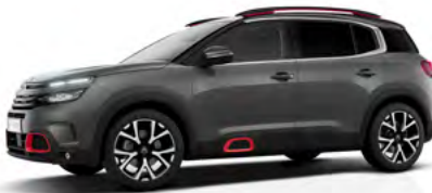
Sivá Platinum (M)