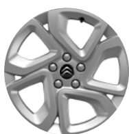
Disk z ľahkej zliatiny ELLIPSE, 17"