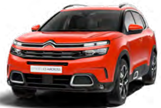
Pack Color Silver (strieborná)