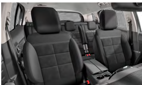
Mix ALCANTARA čierna + látka (TEP) čierna / interiér Urban Black