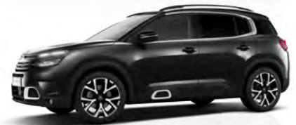
Čierna Perla Nera (M)