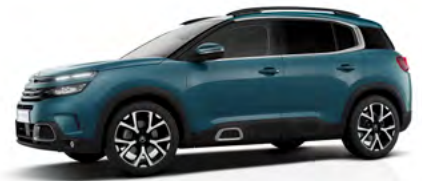
Modrá Tijuca (M)