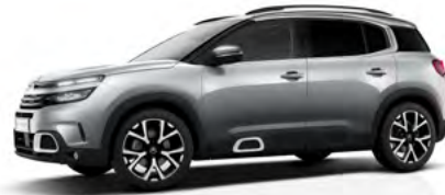
Sivá Artense (M)