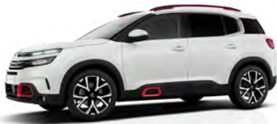
Bielá Nacré (P)