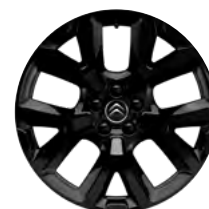
Disk z ľahkej zliatiny ART ČIERNY, 19"

• Štandardná výbava / – nedá sa objednať / (1) – Šírka vozidla, šírka vozidla so sklopenými spätnými zrkadlami; (2) – S pozdĺžnymi tyčami; (3) – Rezervné koleso je potrebné objednať ako príslušenstvo. Cena rezervného kolesa je orientačná a môže sa meniť v závislosti od objednaných dielov k samotnému rezervnému kolesu. Presný rozpis dielov dodávaných s rezervným kolesom a iných detailov Vám poskytne predajca. Pre viac informácií o obsahu servisného kontraktu, ako aj o možnostiach inej kombinácie dĺžky kontraktu a najazdených kilometrov, kontaktujte ktoréhokoľvek predajcu CITROËN, alebo kliknite na www.citroen.sk .