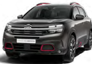
Pack Color Deep Red (červená)