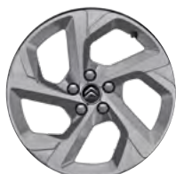
Disk z ľahkej zliatiny SWIRL, 18"