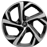
Disk z ľahkej zliatiny SWIRL diamantée, 18"