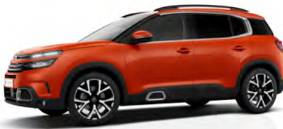
Červená Volcano (M)