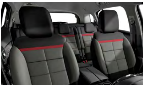
Mix látky s efektom kože (TEP) čierna + látka Stone sivá (v sérii pre FEEL PACK)