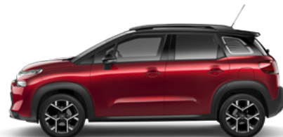
ČERVENÁ PEPERONCINO (M)