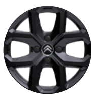
Disk z ľahkej zliatiny X CROSS 16" čierny