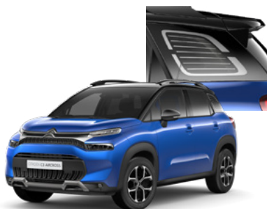
PACK COLOR - ČIERNY