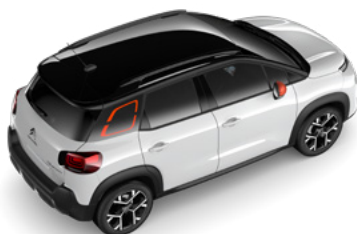
Čierna PERLA NERA