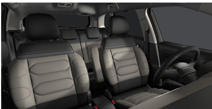
HYPE GREY (1ZFQ)