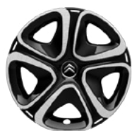
Okrasný kryt STEEL & STYLE 3D 16"