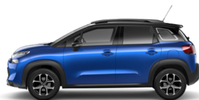
MODRÁ VOLTAIC (M)