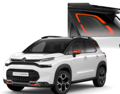
PACK COLOR - ORANŽOVÝ