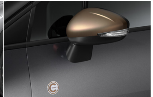
Kryty spätných zrkadiel vo farbe BRONZE a nálepkami C-SERIES