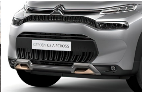
Bronzový ozdobný prvok na prednom nárazníku