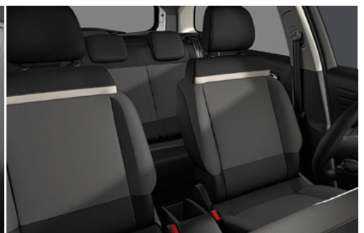
Látkové čalúnenie Mica Grey