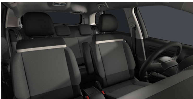
ŠTANDARDNÝ INTERIÉR (4YFT)