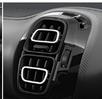
Línie palubnej dosky