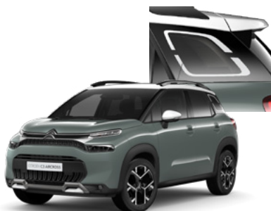
PACK COLOR - BIELY