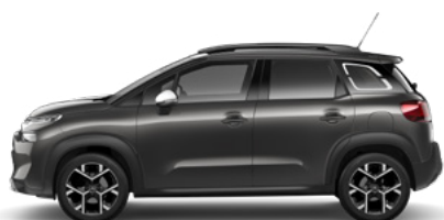
SIVÁ PLATINUM (M)