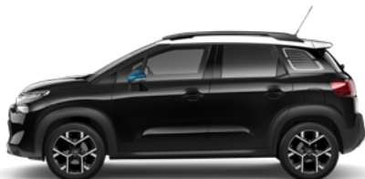
ČIERNÁ PERLA NERA (M)