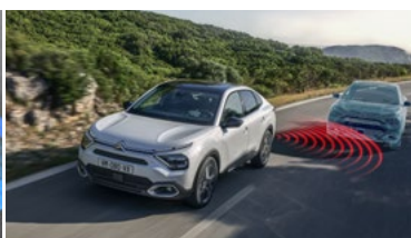
SYSTÉM SLEDOVANIA MŔTVEHO UHLA