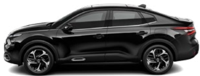
ČIERNA PERLA NERA (M)