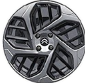
DISK Z LAHKEJ ZLIATINY 18" CAMELIA