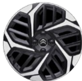
DISK Z LAHKEJ ZLIATINY 18" CAMELIA DIAMANTÉE