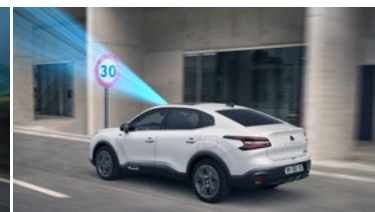
ČÍTANIE DOPRAVNÝCH ZNAČIEK