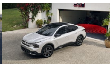
CÚVACIA KAMERA S „TOP REAR VISION“