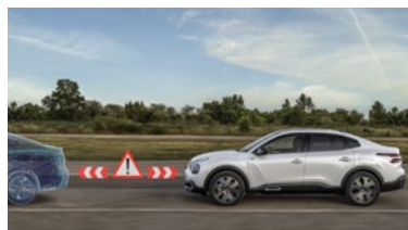
ACTIVE SAFETY BREAK