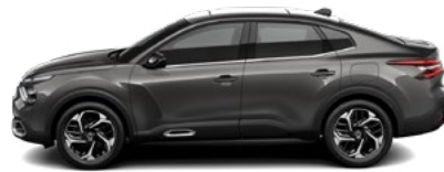
SIVÁ PLATINUM (M)

(M) – metalická farba karosérie, (P) – perleťová farba