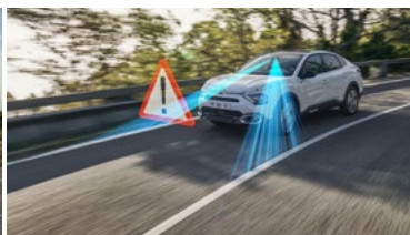
AKTÍVNY SYSTÉM VAROVANIA PROTI OPUSTENIU JAZDNÉHO PRUHU