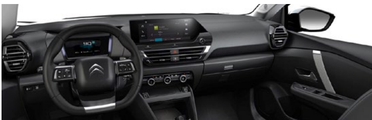
INTERIÉR URBAN GREY (v sérii pre PLUS)