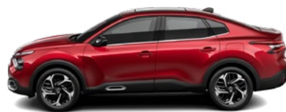
ČERVENÁ ELIXIR (P)