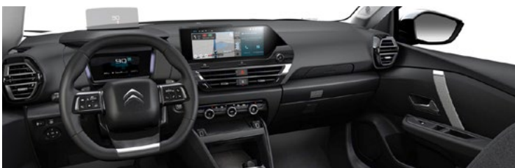
INTERIÉR METROPOLITAN GREY (v sérii pre MAX)