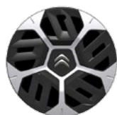
OKRASNÝ KRYT 18" AEROTHECH