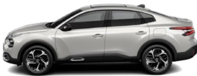
BIELA PERLA NACRÉ (P)