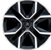
DISK Z LAHKEJ ZLIATINY 18" HANOÝ