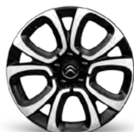
DISK Z ĽAHKEJ ZLIATINY 17" SPIN