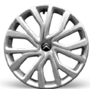
OZDOBNÝ KRYT 16" TWIRL (s čiernym stredom)