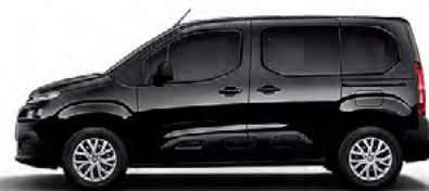
ČIERNÁ PERLA NERA (M)