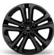
DISK Z ĽAHKEJ ZLIATINY 16" STARLIT