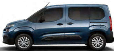
MODRÁ NUIT (M) (Nie je možné objednať pre LIVE PACK)

M – metalická farba; N – nemetalická farba