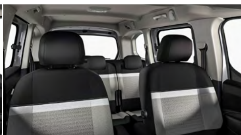
LÁTKA METROPOLITAN GREY (OFFT)