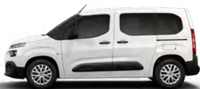
BIELA ICY (N)