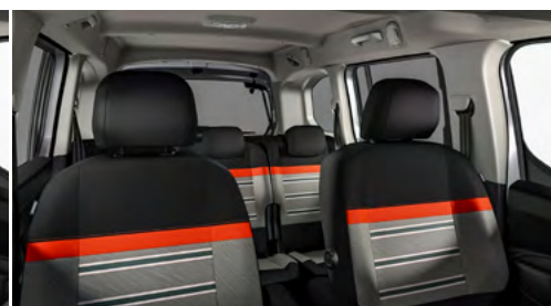
PACK XTR S POŤAHOM WILD GREEN (0GFR)