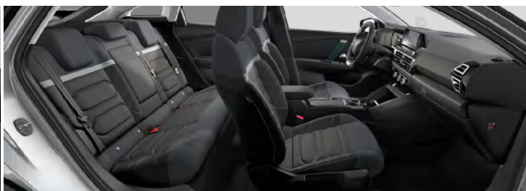
INTERIÉR METROPOLITAN GREY (V SÉRII PRE MAX)