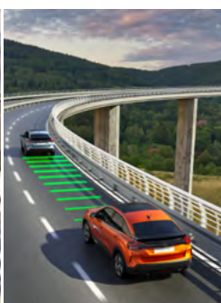
HIGHWAY DRIVER ASSIST