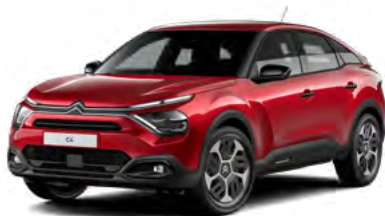
PACK COLOR GLOSSY BLACK