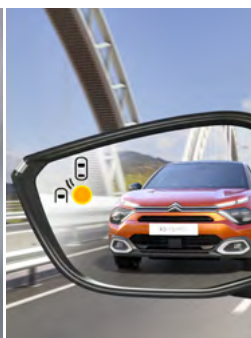
SYSTÉM SLEDOVANIA MŔTVEHO UHĽA