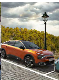
ELEKTRICKÁ PARKOVACIA BRZDA