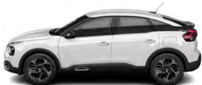
BIELA PERLA NACRÉ (P)

(M) – metalická farba karosérie, (P) – perleťová farba