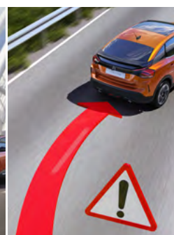
ASISTENT POZORNOSTI VODIČA