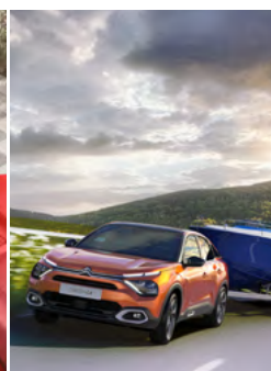
KONTROLA STABILITY ŤAŽNÉHO ZARIADENIA