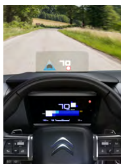
FAREBNÝ HEAD-UP DISPLEJ