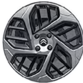
DISK Z LAHKEJ ZLIATINY 18" CAMELIA