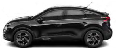
ČIERNA PERLA NERA (M)