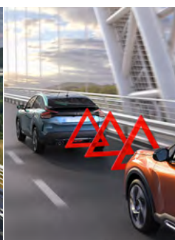
ACTIVE SAFETY BREAK