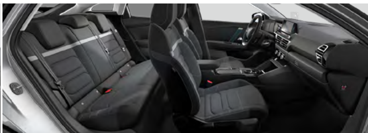
INTERIÉR URBAN GREY (V SÉRII PRE PLUS)