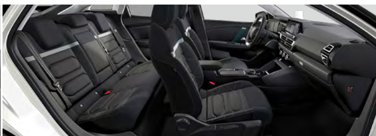
INTERIÉR ALCANTARA GREY