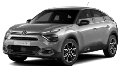
PACK COLOR GLOSSY SILVER