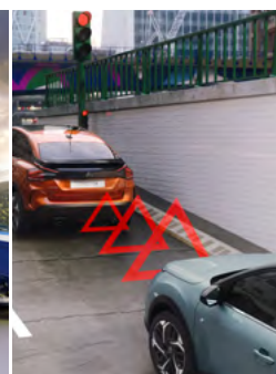
POMOC PRI ROZJAZDE DO KOPCA