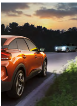
AUTOMATICKÉ PREPÍNANIE DIAĽKOVÝCH SVETIEL