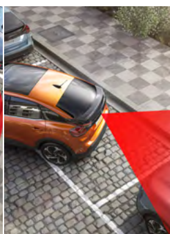
ČUVACIA KAMERA S „TOP REAR VISION“