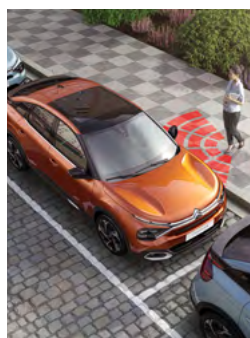
BEZKĽÚČOVÝ PRÍSTUP A ŠTARTOVANIE