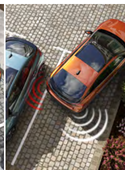
BOČNÝ PARKOVACÍ ASISTENT