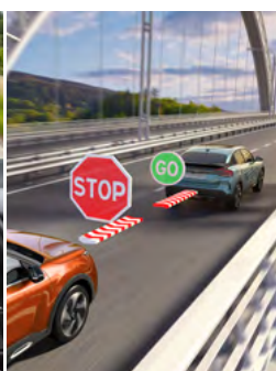
ADAPTÍVNY TEMPOMAT S FUNKCIOU STOP&GO