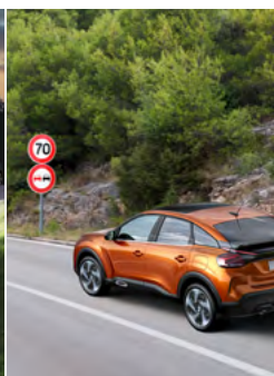
ČÍTANIE DOPRAVNÝCH ZNAČIEK