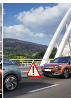
UPOZORNENIE NA RIZIKO KOLÍZIE