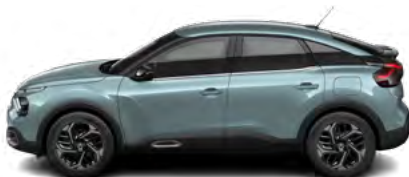
MODRÁ ICELAND (M)