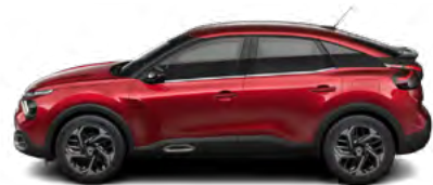
ČERVENÁ ELIXIR (P)