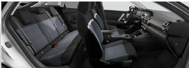
ŠTANDARDNÝ INTERIÉR (PRE YOU!)