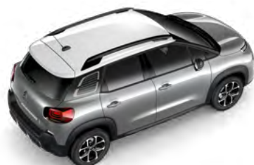
Biela NATURAL (1)