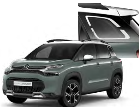
PACK COLOR - BIELY