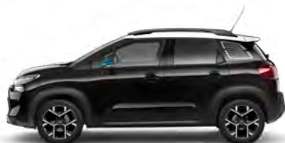
ČIERNÁ PERLA NERA (M)