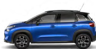
MODRÁ VOLTAIC (M)