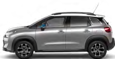
SIVÁ ARTENSE (M)