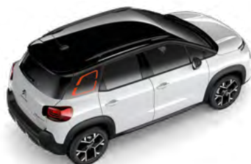
Čierna PERLA NERA