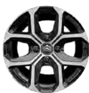
Disk z ľahkej zliatiny X CROSS 16" s výbrusom