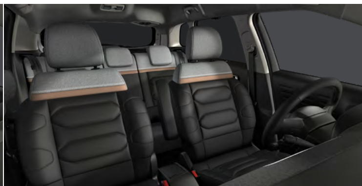
METROPOLITAN GRAPHITE (1QFX)