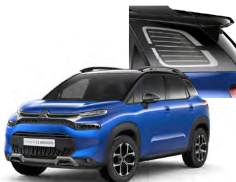
PACK COLOR - ČIERNY