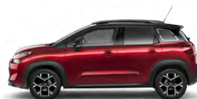
ČERVENÁ PEPERONCINO (M)