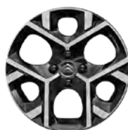
Disk z ľahkej zliatiny ORIGAMI 17" s výbrusom