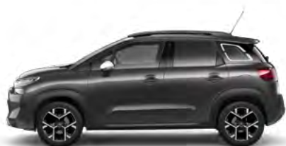
SIVÁ PLATINUM (M)