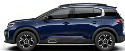
MODRÁ ECLIPSE (M)