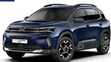
PACK COLOR CHROME