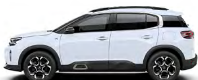
BIELA OKENITE (M)