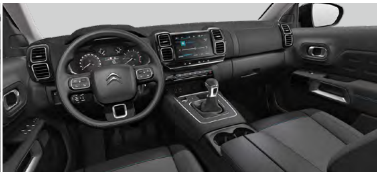
ŠTANDARDNÝ INTERIÉR LÁTKA SILICA ŠEDÁ (v sérii pre YOU!)