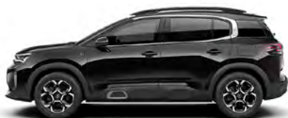
ČIERNÁ PERLA NERA (M)