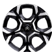
DISK Z LAHKEJ ZLIATINY PULSAR 18"