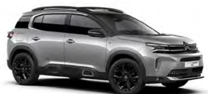
SIVÁ ARTENSE (M)

(M) – metalická farba karosérie, (P) – perleťová farba