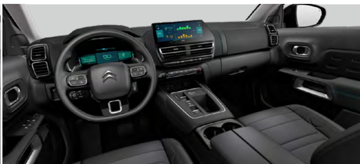
INTERIÉR METROPOLITAN GREY (v sérii pre MAX)