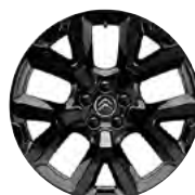
DISK Z LAHKEJ ZLIATINY ART ČIERNY 19"/T & N ČIERNY 19"

(1) Dostupné len na skladových vozidlách, nie je možné objednať do výroby.