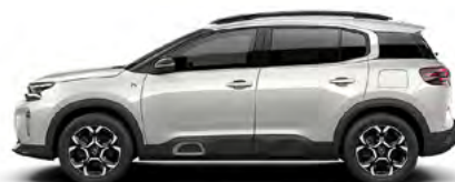
BIELA NACRÉ (P) (1)