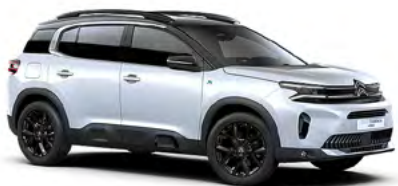
BIELA OKENITE (M)