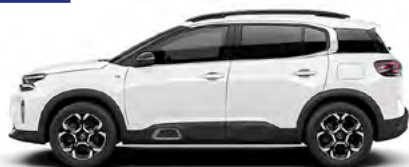
BIELA BLANQUISE (1)