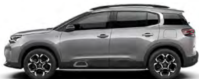
SIVÁ ARTENSE (M)