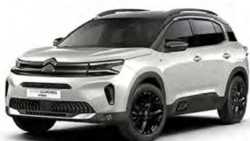
PACK COLOR BLACK