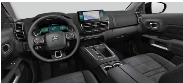
INTERIÉR URBAN BLACK