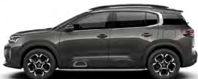
SIVÁ PLATINIUM (M)