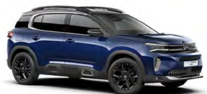
MODRÁ ECLIPSE (M)