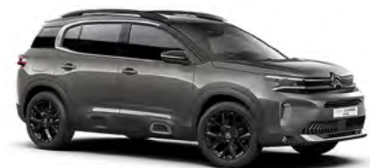
SIVÁ PLATINIUM (M)