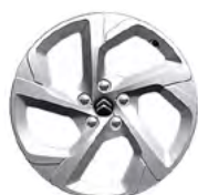
DISK Z LAHKEJ ZLIATINY SWIRL 18"