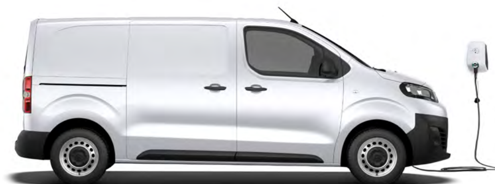
Dobíjanie striedavým prúdom pomocou WALLBOX-u.