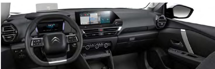
INTERIÉR METROPOLITAN GREY (v sérii pre MAX)