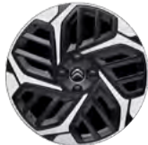
DISK Z LAHKEJ ZLIATINY 18" CAMELIA DIAMANTÉE