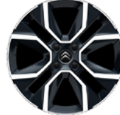
DISK Z LAHKEJ ZLIATINY 18" HANOY