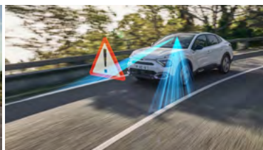
AKTÍVNY SYSTÉM VAROVANIA PROTI OPUSTENIU JAZDNÉHO PRUHU