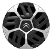
OKRASNÝ KRYT 18" AEROTHECH