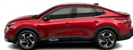
ČERVENÁ ELIXIR (P)