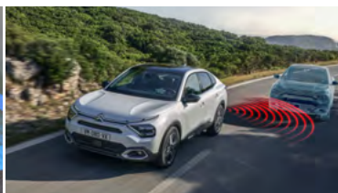
SYSTÉM SLEDOVANIA MŔTVEHO UHLA