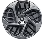
DISK Z LAHKEJ ZLIATINY 18" CAMELIA