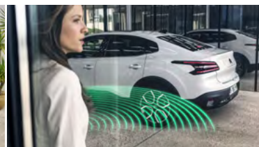
BEZKLÚČOVÝ PRÍSTUP A ŠTARTOVANIE