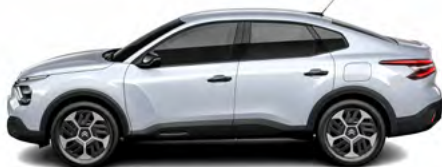
BIELA OKENITE (M)