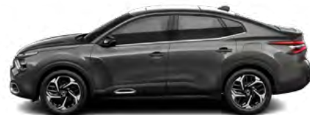
SIVÁ PLATINUM (M)