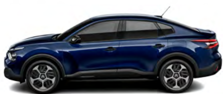
MODRÁ ECLIPSE (M)

(M) – metalická farba karosérie, (P) – perleťová farba