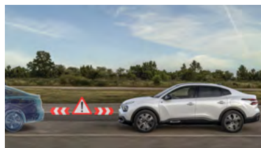
ACTIVE SAFETY BREAK