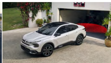
CÚVACIA KAMERA S „TOP REAR VISION“