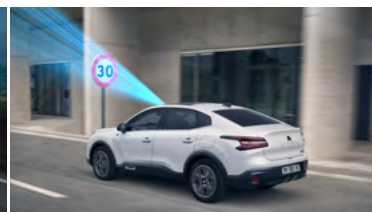
ČÍTANIE DOPRAVNÝCH ZNAČIEK