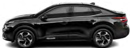
ČIERNA PERLA NERA (M)