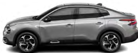
SIVÁ ARTENSE (M)