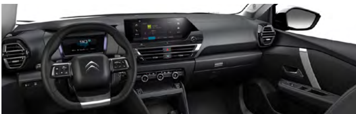
INTERIÉR URBAN GREY (v sérii pre PLUS)