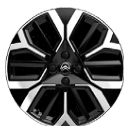
MAX DISK Z LAHKEJ ZLIATINY 18" AMBER