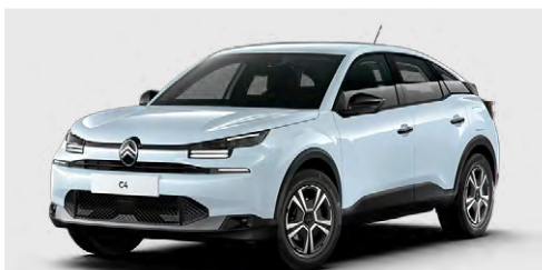
BIELÁ OKENITE (M)