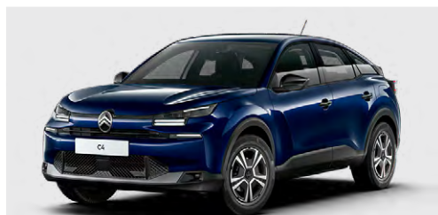
MODRÁ ECLIPSE (M)