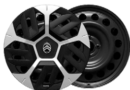
PLUS OKRASNÝ KRYT 18" AEROTECH