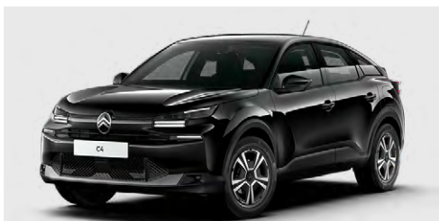
ČIERNÁ PERLA NERA (M)