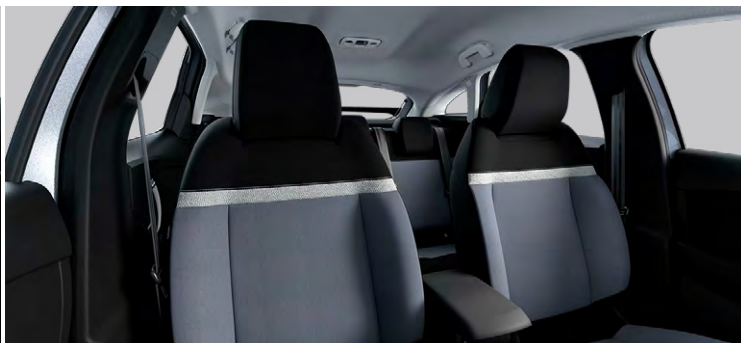
LÁTKOVÉ ČALÚNENIE KOMBINÁCIA SIVÁ/ČIERNA (PRE YOU)