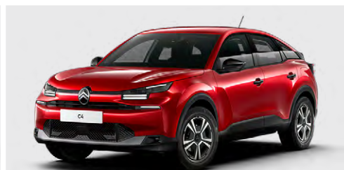
ČERVENÁ ELIXIR (P)

(M) – metalická farba karosérie, (P) – perleťová farba, (N) – nemetalická farba