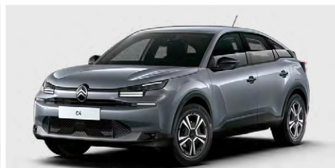
SIVÁ MERCURY (M)