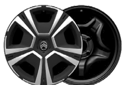
YOU OKRASNÝ KRYT 16" STEEL & DESIGN