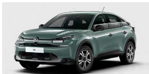
ZELENÁ MANHATTAN (N)