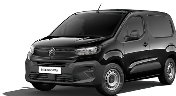
ČIERNÁ PERLA NERA

● – poťah bez príplatku; ○ – opcia. (1) farba karosérie bez príplatku; (2) voliteľná farba karosérie za príplatok; (3) CITROËN ADVANCED COMFORT je voliteľný poťah za príplatok.