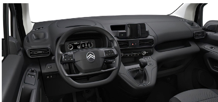
Sivá / čierna látka CURITIBA + BRASILIA