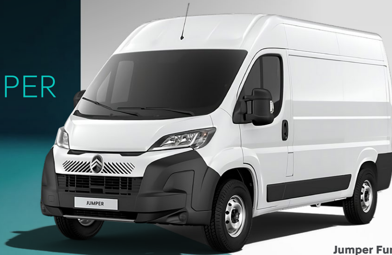
Jumper Furgon 35 L2H2 2.2L BlueHDi 140k

BOHATÁ VÝBAVA PRE PROFESIONÁLOV 1 000 € PRIVILEGE BONUS DOSTUPNÝ IHNEĎ SKLADOM