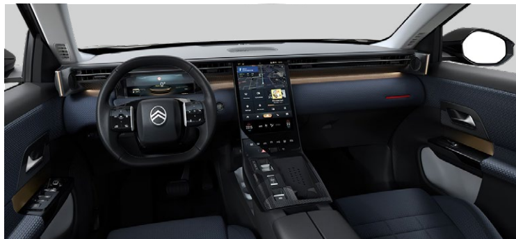
INTERIÉR METROPOLITAN BLUE — V SÉRII PRE PLUS

Kombinácia látky modrá + látka s efektom kože (TEP) modrá Sedadlá Advanced Comfort