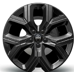
DISK Z LAHKEJ ZLIATINY CARBON 18" (iba pre MHEV)