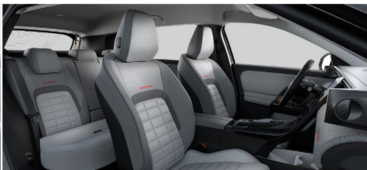
Pneumatická bedrová opierka sedadla vodiča a spolujazdca Nastavenie bočnej opory na predných sedadlách Vyhrievané predné a zadné sedadlá (2 bočné sedadlá) Predné a zadné koberčky Funkcia Clean Cabin s vysokoučinným filtrom a systémom kontroly kvality vzduchu

Perforovaná Prémiová syntetická koža sivá + látka sivá Sedadlá Advanced Comfort Ventilované predné sedadlá Masážne a elektricky nastaviteľné predné sedadlá v 8 smeroch, sedadlo vodiča s pamäťovou funkciou