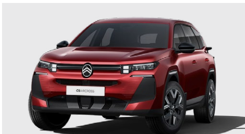
ČERVENÁ RUBY (M)