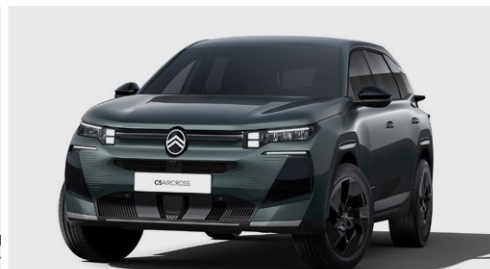
MODRÁ ECLIPSE (M)