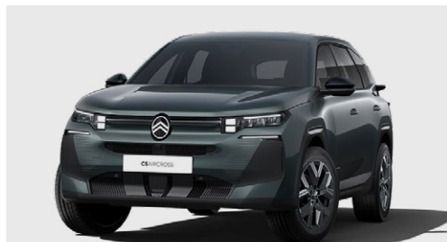
ZELENÁ ASTORIA (M)