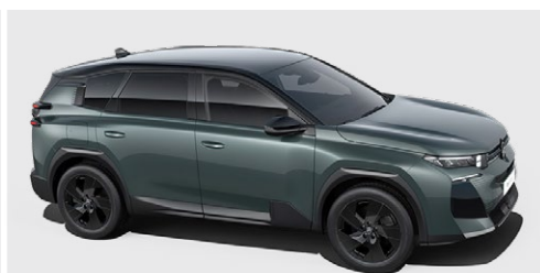
ZELENÁ ASTORIA (M)