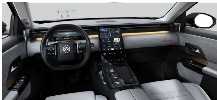
INTERIÉR HYPE GREY — ZA PRÍPLATOK (FDFT)

Perforovaná Prémiová syntetická koža sivá + látka sivá Sedadlá Advanced Comfort Ventilované predné sedadlá Masážne a elektricky nastaviteľné predné sedadlá v 8 smeroch, sedadlo vodiča s pamäťovou funkciou