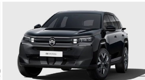
ČIERNA PERLA NERA (M)