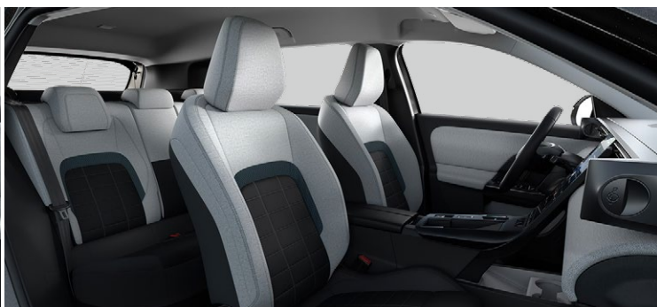
Látkové čalúnenie v kombinácii čierna a sivá Sedadlá Advanced Comfort