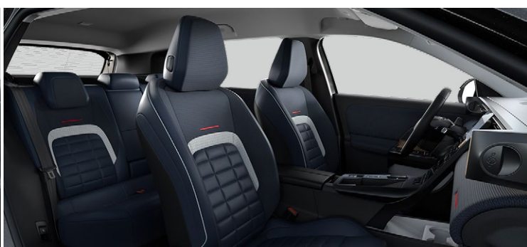
Sedadlo vodiča elektricky nastaviteľné v 8 smeroch s pamäťovou funkciou Pneumatická bedrová opierka sedadla vodiča Vyhrievané predné sedadlá LED osvetlenie priestoru pre nohy

Prémiová syntetická koža modrá + látka modrá Sedadlá Advanced Comfort Odkladacie vrecká na zadnej strane predných sedadiel + vrecká na smartfón