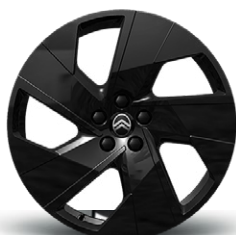
DISK Z LAHKEJ ZLIATINY ZIRCON 19" (iba pre MHEV)