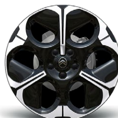
DISK Z LAHKEJ ZLIATINY MOONDUST 19" (nie pre MHEV)