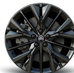
DISK Z LAHKEJ ZLIATINY OBSIDIAN 20" (nie pre MHEV)