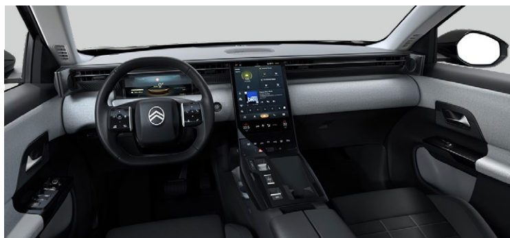
INTERIÉR URBAN GREY — V SÉRII PRE YOU