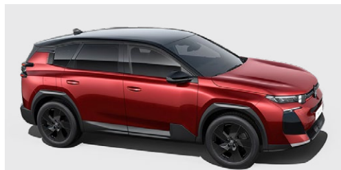
ČERVENÁ RUBY (M)