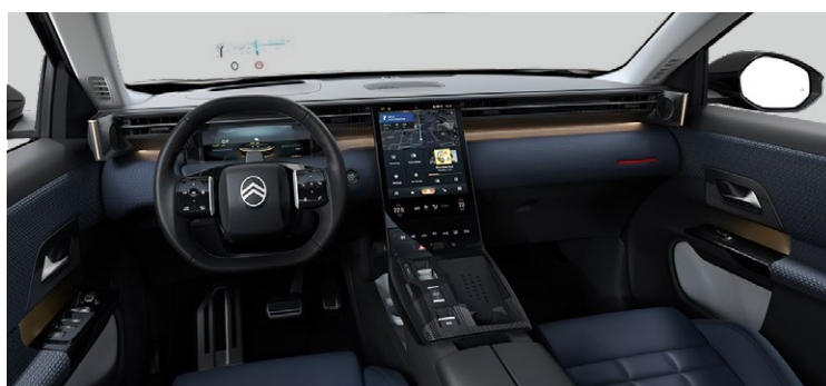
INTERIÉR HYPE BLUE — V SÉRII PRE MAX

Prémiová syntetická koža modrá + látka modrá Sedadlá Advanced Comfort Odkladacie vrecká na zadnej strane predných sedadiel + vrecká na smartfón