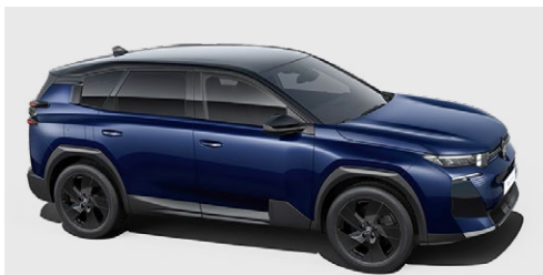
MODRÁ ECLIPSE (M)