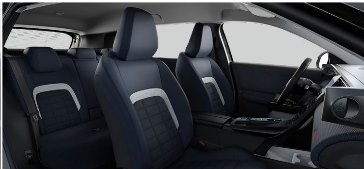
Odkladacie vrecká na zadnej strane predných sedadiel + vrecká na smartfón Sedadlo vodiča s manuálnou bedrovou opierkou

Kombinácia látky modrá + látka s efektom kože (TEP) modrá Sedadlá Advanced Comfort