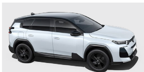
BIELA OKENITE (M)