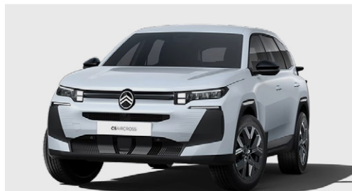
BIELA OKENITE (M)