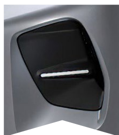
PRE SIVÚ MERCURY