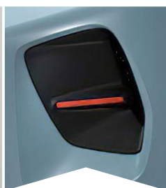
PRE MODRÚ MONTE CARLO