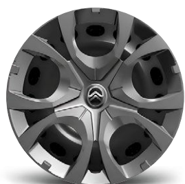
OKRASNÝ KRYT PYRITE 16"