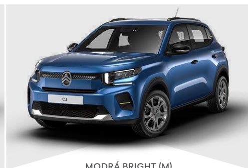
MODRÁ BRIGHT (M)

(M) – metalická farba karosérie, (N) – nemetalická farba