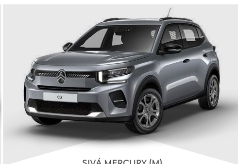
SIVÁ MERCURY (M)