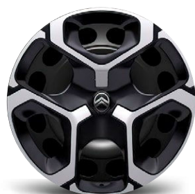
OKRASNÝ KRYT AZURITE 17"