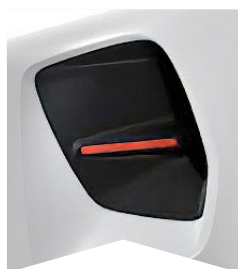
PRE BIELU BANQUISE