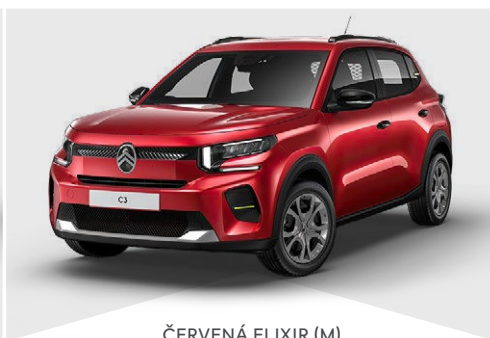
ČERVENÁ ELIXIR (M)