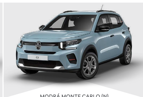
MODRÁ MONTE CARLO (N)