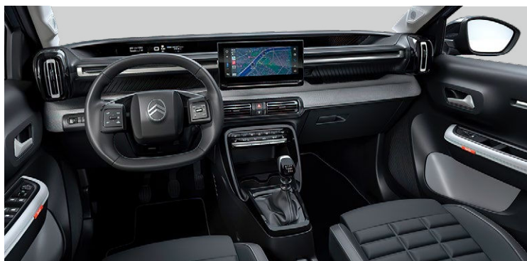
INTERIÉR METROPOLITAN GREY (NHFX)