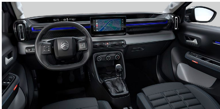
INTERIÉR URBAN GREY (NBFX)