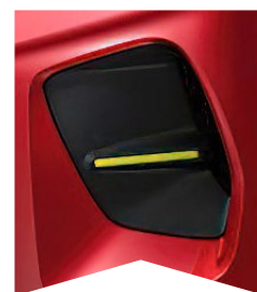
PRE ČERVENÚ ELIXIR