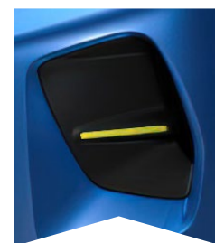
PRE MODRÚ BRIGHT