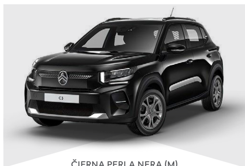
ČIERNÁ PERLA NERA (M)