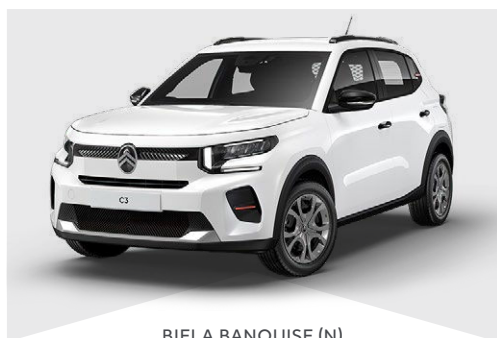
BIELA BANQUISE (N)