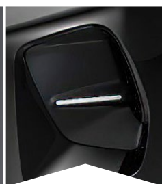
PRE ČIERNU PERLA NERA